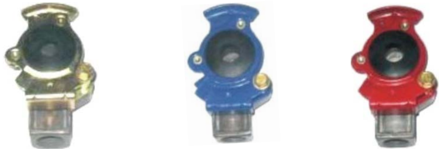
Plate Aluminum 夹板铝偶合器